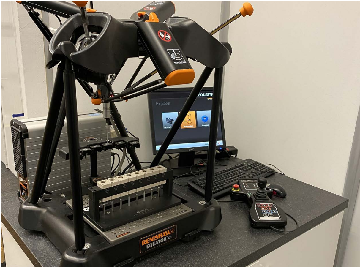
Tubos y cápsulas sujetos en uno de los diseños de fijación metrológica de Verus para la inspección en el sistema de calibre Equator™ 300