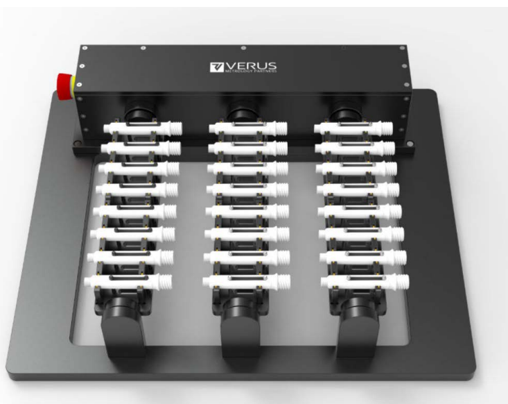
Una de las soluciones de fijación a medida de Verus Metrology Partners

En la carrera por combatir la pandemia de COVID-19, la distribución de kits de test es la máxima prioridad. En el proceso de producción de componentes de los kits de test, los fabricantes no podían permitir que los procesos metrológicos se convirtieran en cuellos de botella. El cliente de Verus Metrology Partners solicitó un incremento del rendimiento metrológico para adaptarse al ritmo de producción de las piezas.