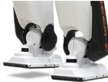
걷는 단계에서 한 발로 균형을 유지하는 REEM-C

균형을 제어하기 위해서는 각 관절에 피드백 시스템을 구현하여 REEM-C와 같은 로봇의 안정성을 평가하는데 사용할 수 있는 균형점(Zero Moment Point, ZMP)를 계산합니다. 측정된 ZMP는 '퍼지 로직(fuzzy logic)' PD 컨트롤러에 입력되고 원하는 ZMP를 추적함으로써 균형 유지와 외란 제거를 달성합니다. 컨트롤러의 목표는 로봇의 질량 중심(CoM) 위치를 조정하여 ZMP 지점을 항상 지지 영역(발 아래) 안에 유지하는 것입니다. 2족 동적 보행에 성공하려면 로터리 엔코더 피드백을 통해 위치, 속도 및 가속도에 대한 다리 관절 각을 정밀하게 제어해야 합니다.