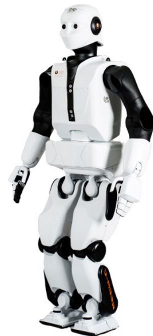
PAL Robotics의 실물 크기 2족 휴머노이드 로봇 REEM-C

로봇 설계와 프로그래밍, 조립은 모두 바르셀로나 PAL Robotics 지사에서 진행되며, 엔지니어팀이 로봇의 기능을 지속적으로 개선하는 일에 매진하고 있습니다.