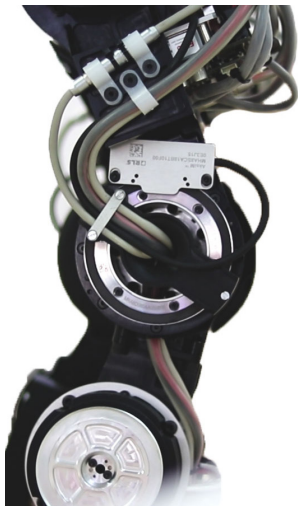
AksIM™ 앵슬루트 로터리 엔코더 시스템을 적용한 REEM-C의 무릎 관절

REEM-C와 PAL Robotics의 다른 휴머노이드 로봇들은 작업에 따라 광범위하고 복잡한 동작을 수행할 수 있는 완벽한 관절을 가지고 있습니다. 토크, 속도 및 위치 측면에서 각 관절의 서보