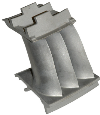
Łopatkı AEREO firmy EMA