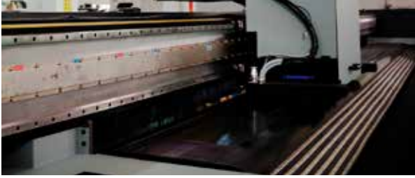
雷尼绍RGH41光栅搭配直线电机