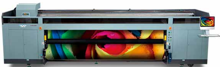
润天智Xtra5000系列宽幅面平板喷绘机