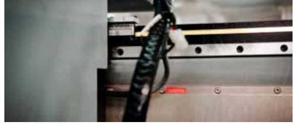
光栅读数头设有安装指示灯

喷绘机主要由喷头、电机、运动控制系统和材料传送系统等主要部分组成，可实现高速二维打印。机器的X轴（横向）采用直线电机并配置雷尼绍RGH41系列光栅系统，搭配1 μm分辨率的RGS40S系列镀金栅尺，负责控制喷头的横向打印。而Y轴多以伺服电机驱动，负责材料输送和定位，从而使设备能够精确地不同材质、体积、高度和形状的材料上完成打印工作。