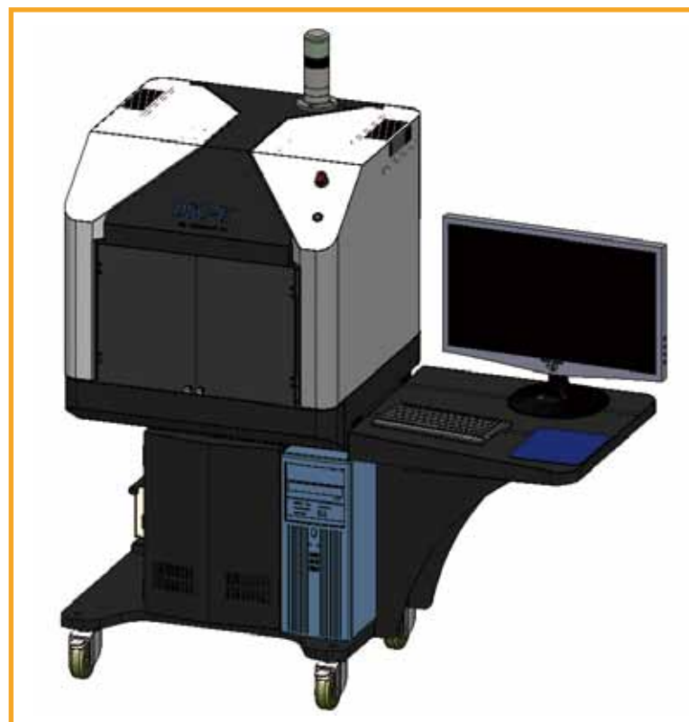
DSC-E1系列镜头检测设备