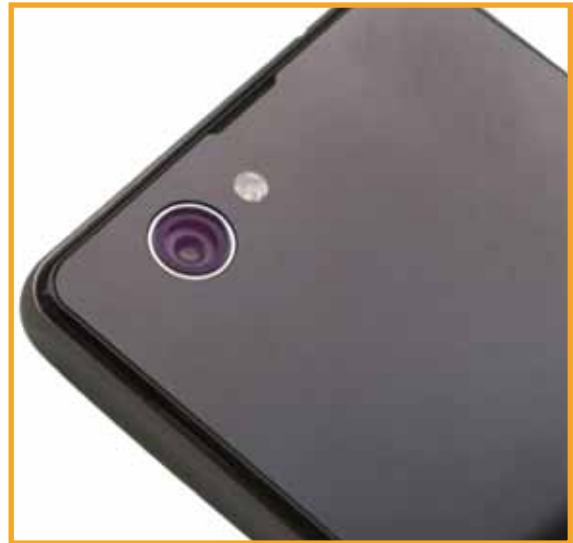
智能手机微型镜头