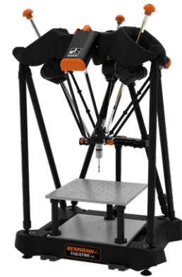
Calibro versatile Equator™ 300

Equator è l'innovativo sistema di ispezione Renishaw. Attenendosi al tradizionale metodo che confronta i pezzi di produzione con un pezzo campione di riferimento, Equator offre alle linee di produzione un sistema di ispezione estremamente ripetibile, facilmente riprogrammabile e immune alle variazioni termiche.