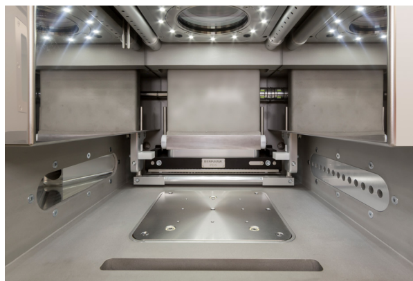
Camera di lavoro del sistema di stampa 3D in metallo RenAM 500M

Solitamente, gli scambiatori di calore sono prodotti utilizzando fogli sottili di materiale che vengono uniti tramite saldatura. Data la complessità del design, la produzione risulta lunga e complessa e il materiale utilizzato per il processo di saldatura contribuisce ad aumentare il peso totale del pezzo. Prima della nascita di HiETA, esistevano poche ricerche approfondite sull'applicazione dell'additive manufacturing agli scambiatori di calore. La sfida iniziale consisteva nel verificare che l'AM fosse in grado di generare pareti sufficientemente sottili e di buona qualità, per poi passare alla produzione di un componente complesso come uno scambiatore di calore.