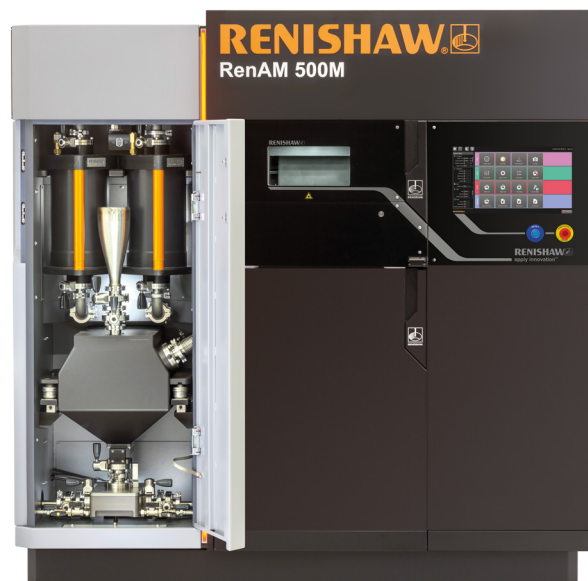
HiETA ha investito nell'acquisto di un più potente sistema RenAM 500M per ottimizzare la produzione di piccoli lotti di componenti commerciali

Infine, l'esperienza e le conoscenze acquisite vennero utilizzate per spostare il processo dalla lavorazione di campioni e prototipi alla produzione di piccoli lotti.