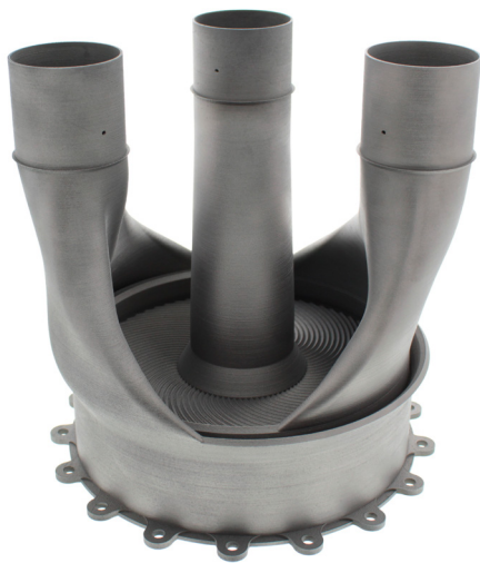
Recuperatore SLAMMiT (Fusione laser selettiva di microturbine)

Il primo tentativo di creare uno scambiatore completo su una Renishaw AM250 ha avuto successo, ma ha richiesto diciassette giorni di tempo ciclo. Con accorgimenti hardware, software e di parametri processo, i tempi si sono ridotti a ottanta ore.