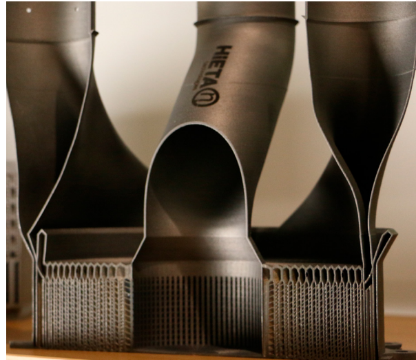
Recuperatore SLAMMiT in sezione

Una serie di test approfonditi ha mostrato che il componente era conforme ai requisiti, sia in termini di calo di pressione, sia di trasferimento di calore. Il componente prodotto, oltre a rispettare i livelli prestazionali richiesti, presentava un peso e un volume del 30% inferiori rispetto a un pezzo equivalente prodotto con metodi convenzionali.