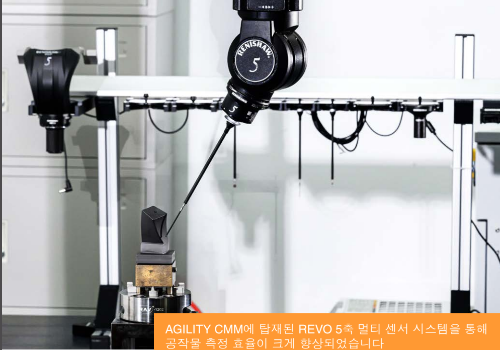
AGILITY CMM에 탑재된 REVO 5축 멀티 센서 시스템을 통해 공작물 측정 효율이 크게 향상되었습니다