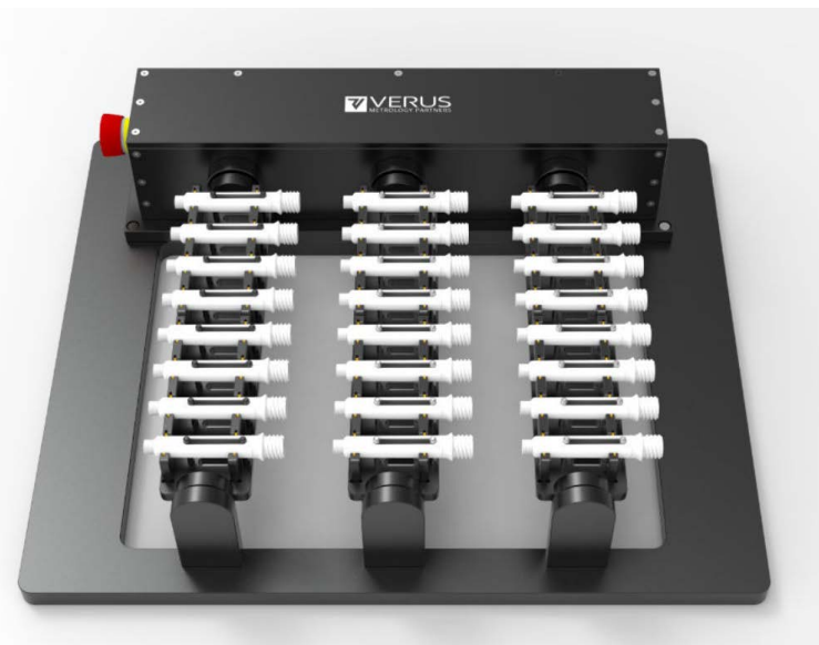
Verus Metrology Partners的定制型夹具解决方案之一

在全球抗击新冠肺炎疫情 (COVID-19) 的战斗中, 争分夺秒地快速分发新冠病毒检测试剂盒是制胜的关键。为实现塑料试剂盒零部件的大规模生产, 测量环节绝不能成为掣肘整个生产流程的瓶颈。受客户委托, Verus Metrology Partners 公司开发出可提升测量效率的新型解决方案, 实现了测量速度与生产速度同步。