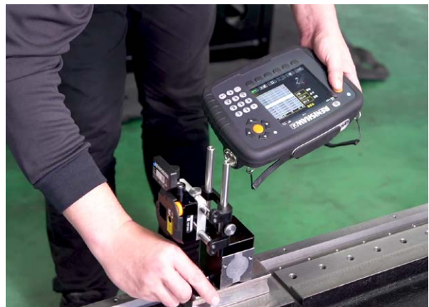
측정 데이터의 수집, 분석, 기록을 위한 XK10의 디스플레이 장치