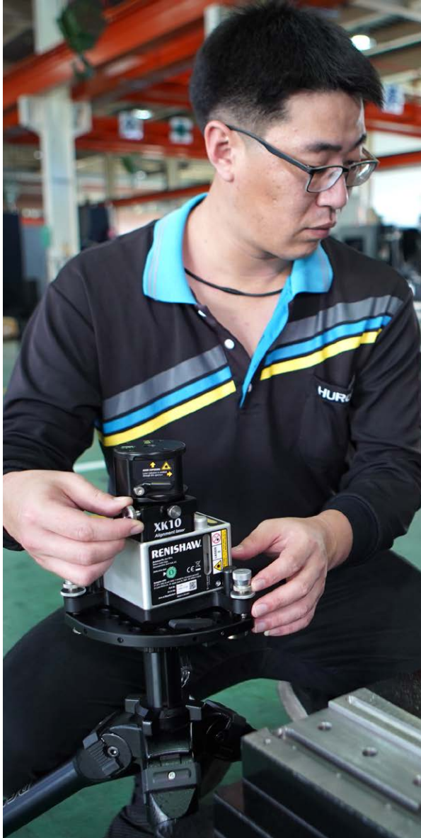
Hurco에서 XK10 정렬 레이저 시스템을 사용하는 모습