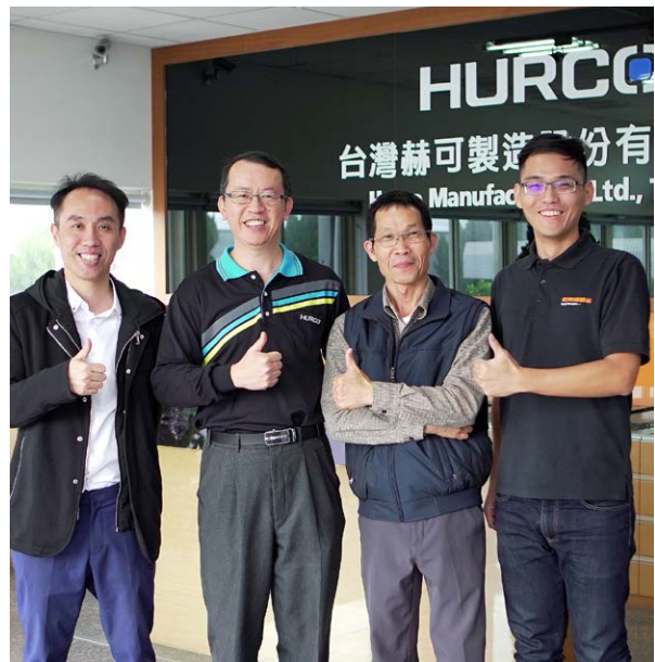
Hurco와 Renishaw의 팀원들

Hurco Manufacturing은 1999년에 대만에서 설립되었으며 오늘날 모든 Hurco 공작 기계의 제조와 조립 공정을 맡고 있습니다. 공작기계의 정밀도, 안전성, 신뢰성에 대한 요구사항을 확실히 충족하기 위해서는 각 제조 공정에서 엄격하게 품질을 관리하는 것이 그 무엇보다 중요합니다.