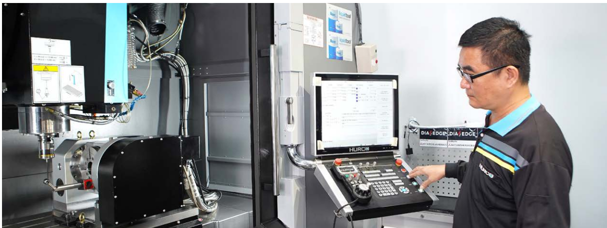
공작물 검사와 워크 셋업에 Renishaw RMP600 고정밀 접촉식 프로브도 사용하고 있는 Hurco