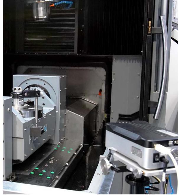
Renishaw의 XL-80 레이저 시스템, XR20-W 로터리 축 캘리브레이터를 사용하는 Hurco

Hurco는 처음에 설립되었을 때부터 XL-80 레이저 간섭계, QC20-W 볼바 시스템, XR20-W 로터리 축 캘리브레이터를 비롯해 Renishaw의 거의 모든 캘리브레이션 제품을 사용해 왔습니다. Wang은 다음과 같이 설명합니다. “XK10을 추가함으로써 측정 관련 지원 범위가 더 넓어졌으며, 공작 기계 조립, 캘리브레이션, 유지보수를 위한 전용 계측기를 확보할 수 있게 되었습니다. 또한 각 CNC 기계의 상태를 보다 잘 이해함으로써 자원을 더 유연하게 배분할 수 있습니다.”