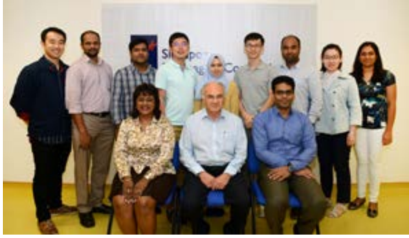
Biopolis 是新加坡生醫科學的研發中樞，也是 SBIC 的所在地

她接著說：「我們需要的是高靈敏度，高分辨率的癌症診斷技術，可以在現場使用，實現對早期癌症的有效即時管理。」