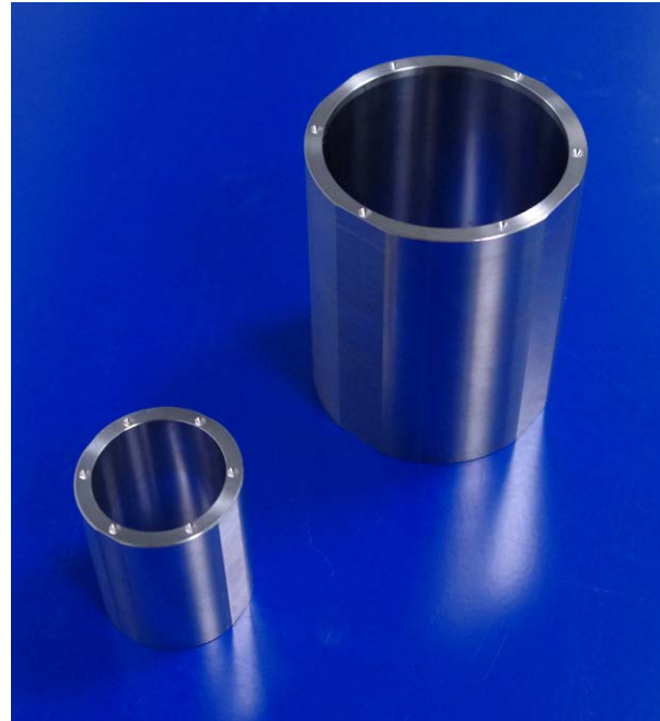
MICROSCOPE 世界太空任務的量測圓柱體達到 1\mu\text{m} 的準確度。

由於製造期間在尺寸、均勻度、圓柱度、平行度及所有圓柱體鄰接表面的傾斜度方面，都達到 1\mu\text{m} 至 2\mu\text{m} 的高精準度，因此質量塊尺寸的準確度高達 10\text{-}15\mu\text{m} 。這樣太空實驗室的物理學家，就能以如此卓越的準確度，量測不同圓柱體對加速力的反應。如果他們發現反應出現不一樣的情形，這項實驗可能掀起固態物理學的思想革命。