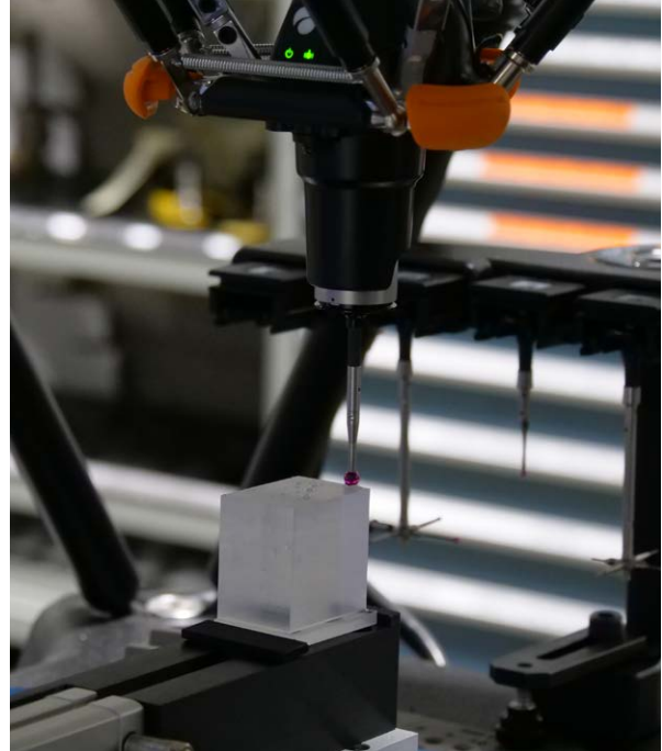
Equator 측정 시스템에서 스캔 중인 정밀 웨지 구성품

Equator 시스템은 CNC 기계와 직접 통신할 수 있어 피쳐 크기 또는 위치 변화가 감지되자마자 필요한 오프셋 업데이트를 자동으로 진행할 수 있습니다. 그 결과 불량 부품 수량이 최소화되었습니다.