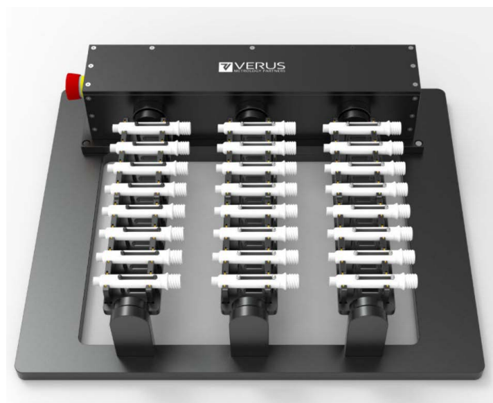
Een van de opspanoplossingen op maat van Verus Metrology Partners

In de race om de wereldwijde COVID-19 pandemie te verslaan, werd de distributie van tests voor het coronavirus een zeer hoge prioriteit. Bij de massaproductie van kunststof onderdelen voor de test-sets konden producenten het niet toelaten dat meetprocessen een knelpunt zouden worden. Verus Metrology Partners kreeg van zijn klant de opdracht om diens meetcapaciteit te verhogen, zodat die bijbleef bij de onderdelenproductie.