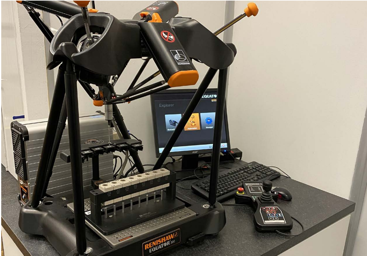
Een van de opspanningen van Verus Metrology met daarin buisjes en dopjes voor inspectie door het Equator™ 300 meetsysteem