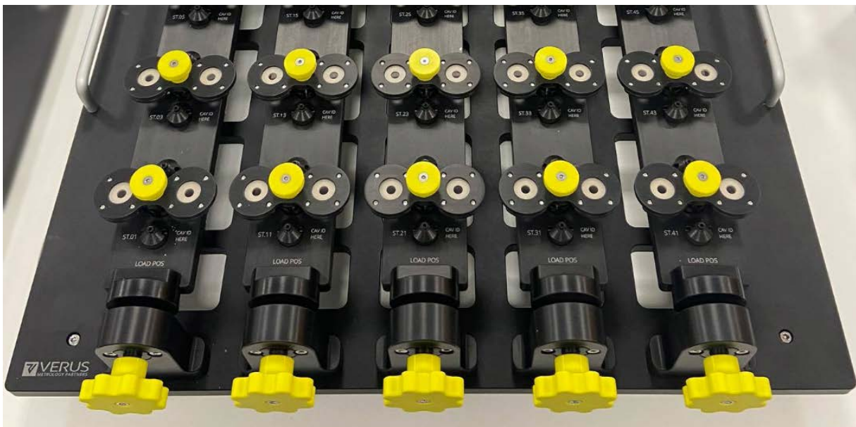
Een 48-stations opspanning op maat van Verus om zachte rubberen componenten te meten