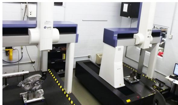
MMT équipées de REVO chez Kawasaki à Maryville

Kawasaki a acheté une nouvelle Mitutoyo Crysta-Apex 121210 en 2009 avec le système REVO pré-installé en usine puis une machine identique en rétrofit en 2010 une fois que la première machine avec tous les programmes-pièce a été mise en service.