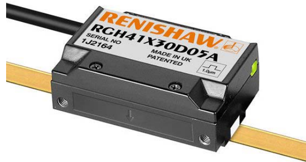
光学式エンコーダ RGH41

SRDEC 社は、2015 年中国の深セン証券取引所に上場した、広告業界向けの業務用インクジェットプリンター市場をリードする企業で、展開する製品には、捺染印刷機、フラットベッド UV プリンター、セラミックタイルインクジェット機などがあります。全生産の半数以上が 100 を超える世界中の国や地域に輸出されています。また、SRDEC 社は ISO9001:2000 の認証を受けており、Printing and Printing Equipment Industries Association of China (PEIAC: 中国印刷および印刷機工業協会) の一員です。