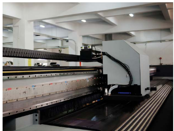
Flora Digital インクジェットプリンター

Flora Digital インクジェットプリンターのスキャン軸（プリンターの軸）にはフィードバック制御を実現するために、レニショー製リニアエンコーダシステム RGH41 とゴールドテープスケール RGS40-P を装着しています。今回のアプリケーションで採用したエンコーダ分解能は 1μm です。サーボ駆動の送り軸（Y 軸）もまた、印刷工程中の素材の処理と印刷基板の位置決めを制御します。」（Sunny Yu 氏）