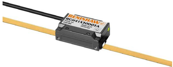
ゴールドテープスケール RGS40 上の光学式エンコーダ RGH41

高品質な印刷に要求される高い応答性を実現できるのは、リニアモータだけでなく、機械的なトランスミッションでは不可能なのです。エンコーダの役割は、リニアモータの動きを正確に常トラッキングすることにあります。